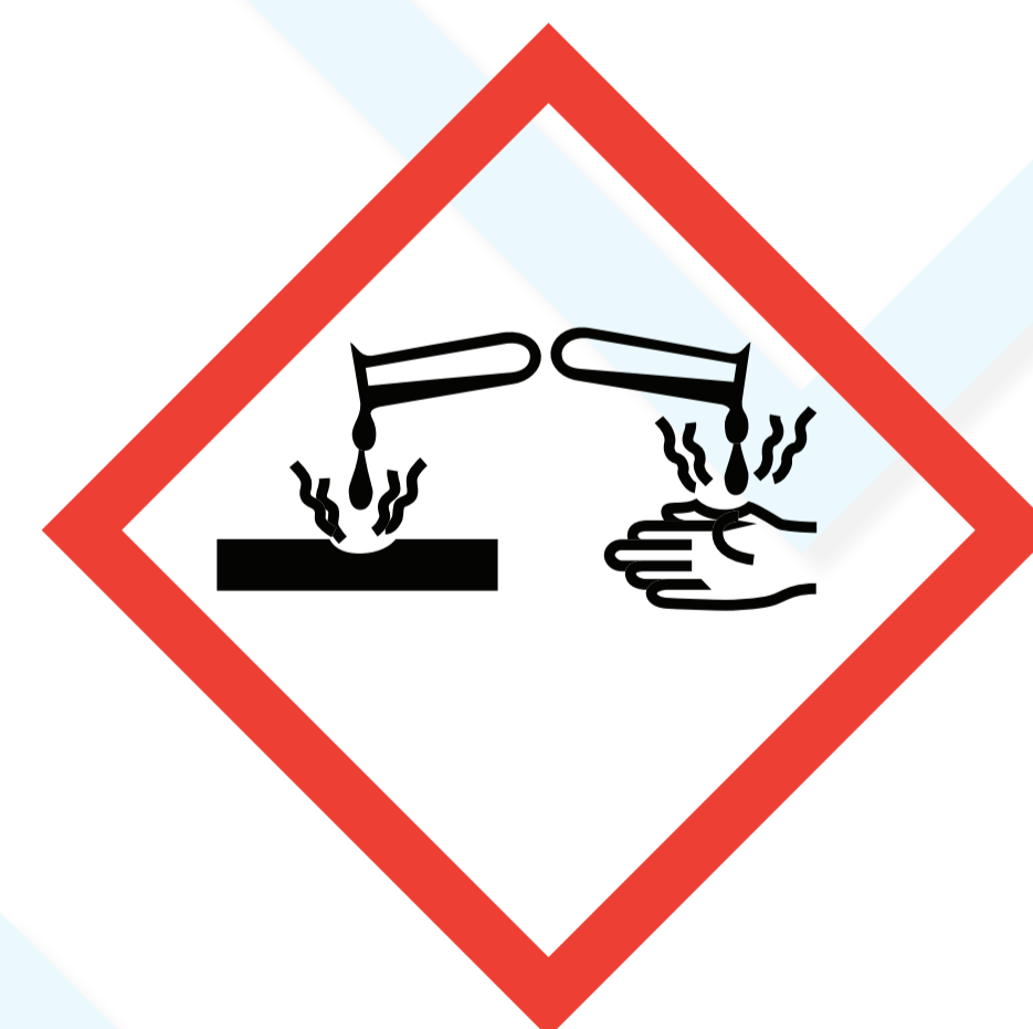
Ätzend / korrosiv

Die Stoffe können, auch ohne Beteiligung von Luftsauerstoff, mit Wärmeentwicklung und unter schneller Entwicklung von Gasen reagieren. Sie explodieren leicht oder verpuffen schnell. Achtung Explosionsgefahr!