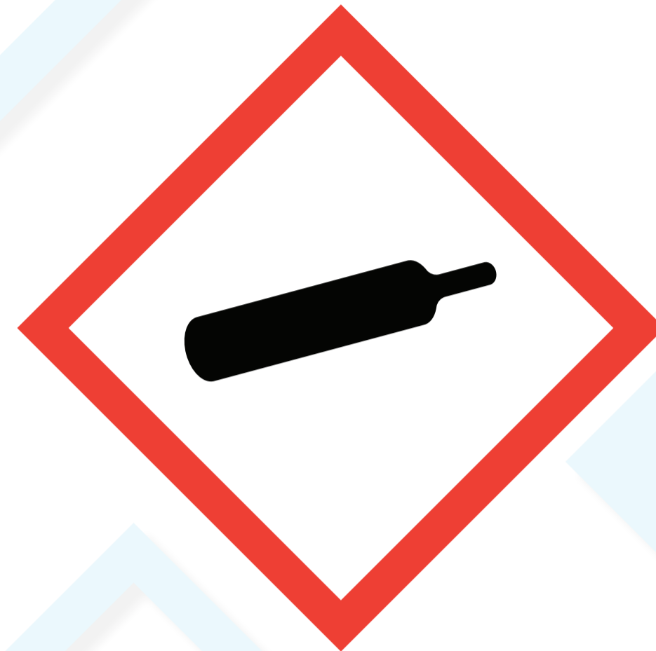
Gase unter Druck

Produkte mit diesem Piktogramm entzünden sich leicht. Besondere Vorsicht mit dem Produkt bei Hitze, Feuer oder in der Nähe von offenen Flammen. Bei falscher Lagerung kann es sich auch selbst entzünden.